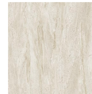
79,8×79,8×1 cm POLER - MAT | POLISHED - MATT