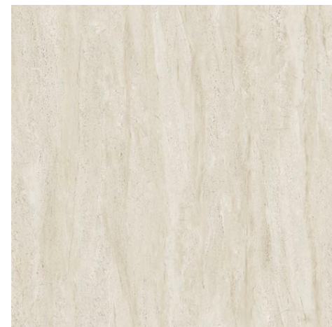
119,8×119,8×0,6 cm POLER - MAT | POLISHED - MATT