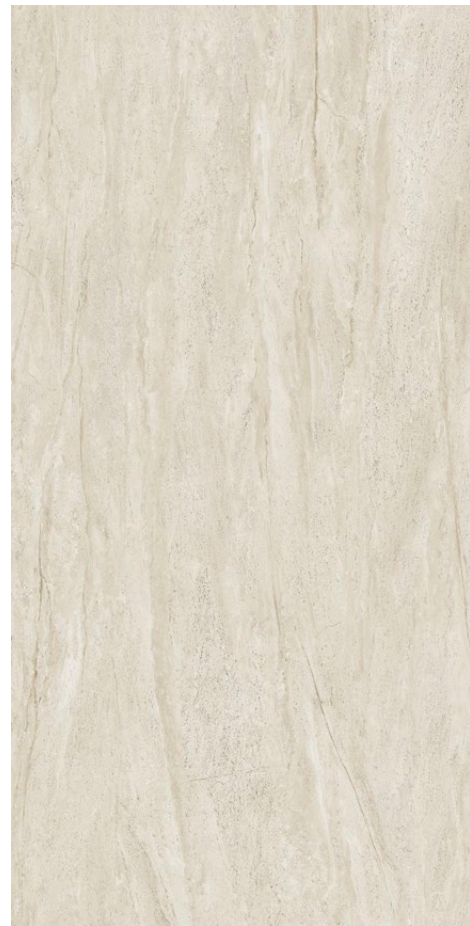
119,8×239,8×0,6 cm POLER - MAT | POLISHED - MATT