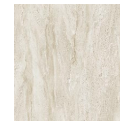
59,8×59,8×1 cm MAT | MATT