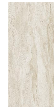
44,8×89,8×1 cm MAT | MATT