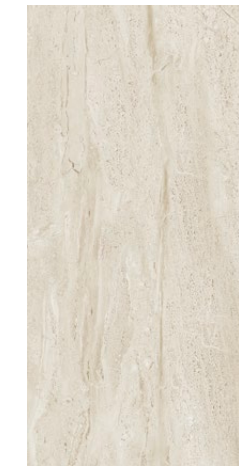
59,8×119,8×1 cm POLER - MAT | POLISHED - MATT