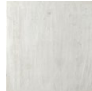
Memory Blanco 44,5x44,5 · FZYT61K011 · M1330