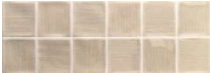
Mosaico Arlette Vison · 21,4x61 · FZV1TGH141 · M1180