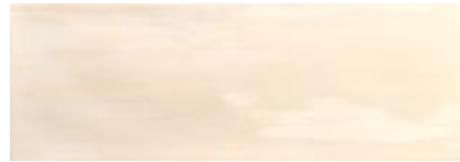
Arlette Beige · 21,4x61 · FZVT1GH041 · M1060