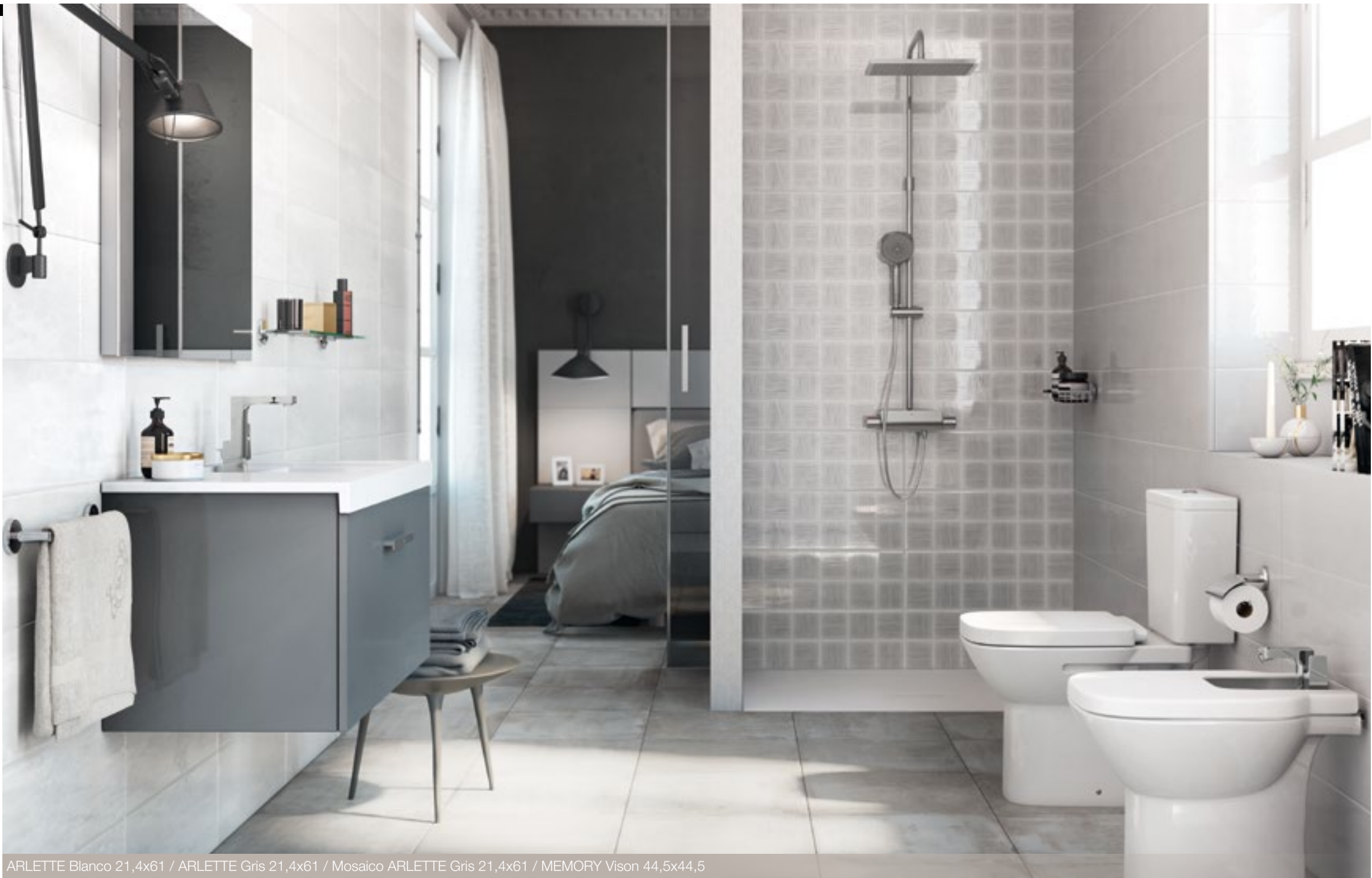
ARLETTE Blanco 21,4x61 / ARLETTE Gris 21,4x61 / Mosaico ARLETTE Gris 21,4x61 / MEMORY Vison 44,5x44,5