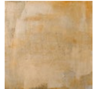
Memory Cotto 44,5x44,5 · FZYT61K501 · M1330