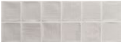
Mosaico Arlette Gris · 21,4x61 · FZV1TGH021 · M1180