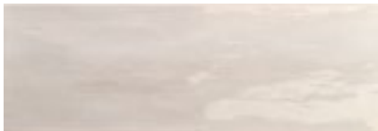
Arlette Gris · 21,4x61 · FZVT1GH021 · M1060