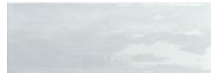
Arlette Aqua · 21,4x61 · FZVT1GH651 · M1090