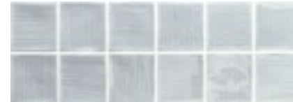
Mosaico Arlette Aqua · 21,4x61 · FZV1TGH651 · M1180