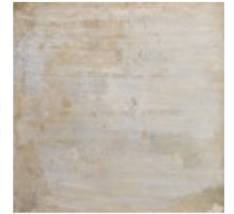
Memory Multicolor 44,5x44,5 · FZYT61KMC1 · M1330