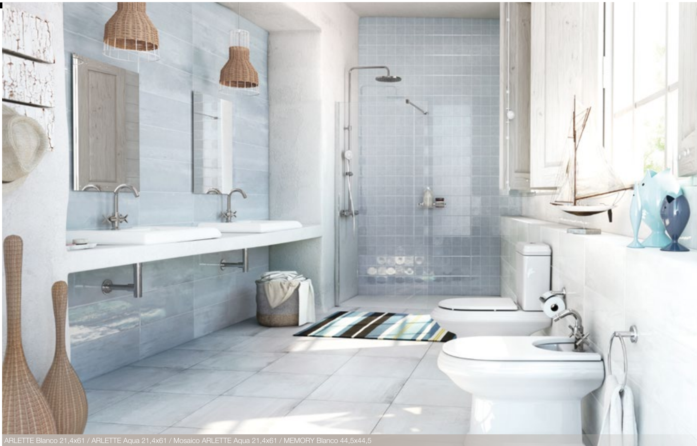
ARLETTE Blanco 21,4x61 / ARLETTE Aqua 21,4x61 / Mosaico ARLETTE Aqua 21,4x61 / MEMORY Blanco 44,5x44,5