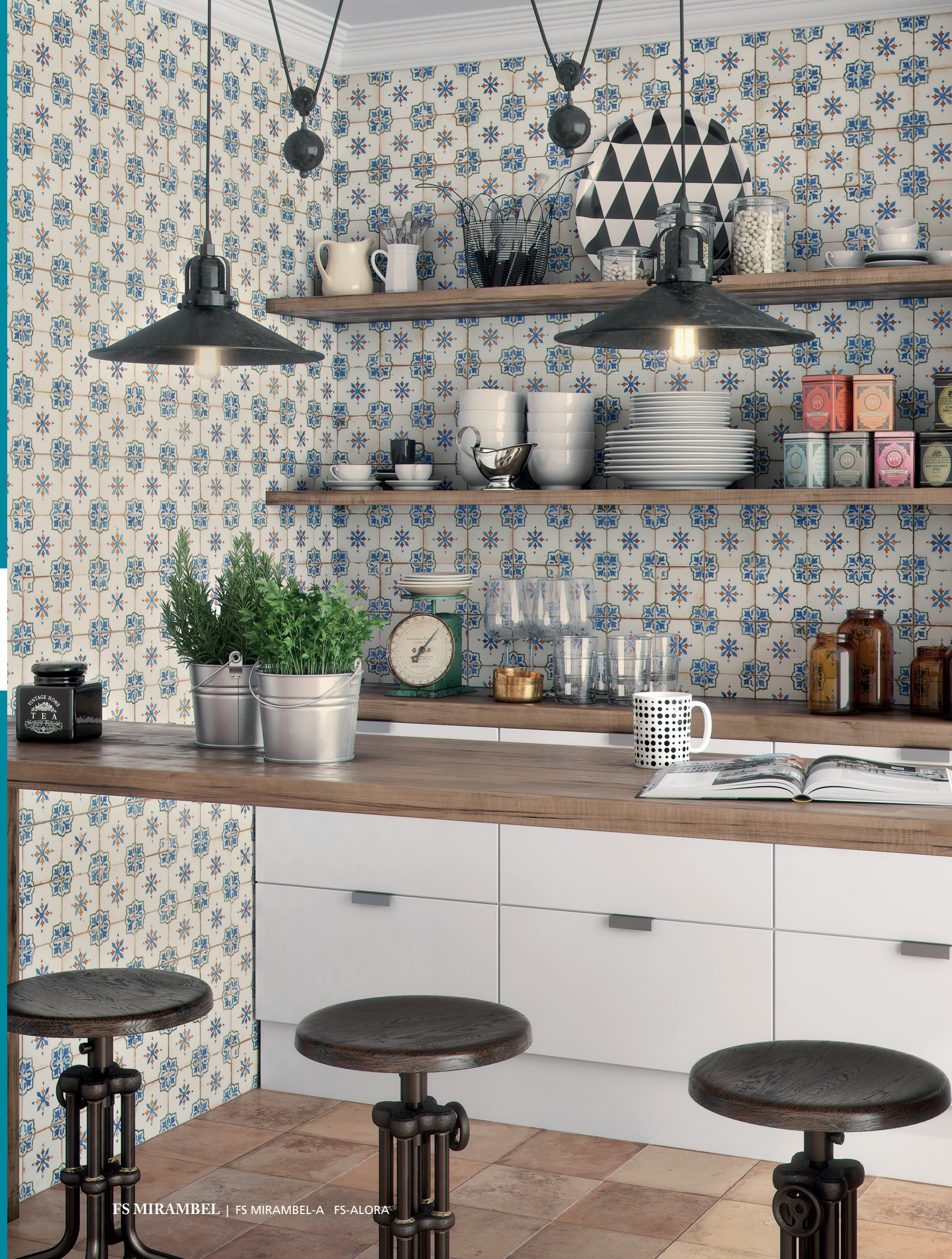
FS MIRAMBEL | FS MIRAMBEL-A FS-ALORA