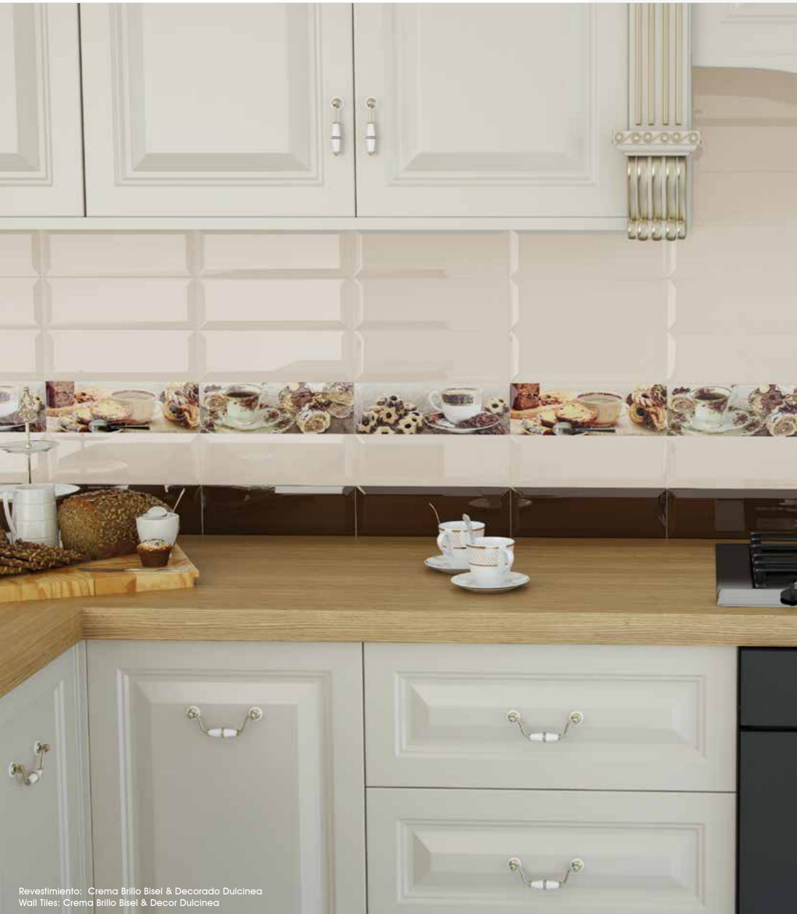
Revestimiento: Crema Brillo Bisel & Decorado Dulcinea Wall Tiles: Crema Brillo Bisel & Decor Dulcinea