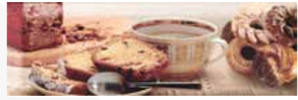
DULCINEA BISCUIT 10X30 MPP170