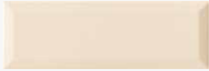
CREMA BRILLO BISEL 10X30 MPB60