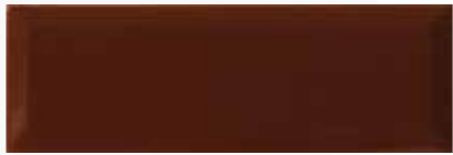
MARRON BRILLO BISEL 10X30 MPB70