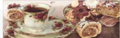
DULCINEA MERENGUE 10X30 MPP170