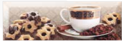
DULCINEA ESTRELLA 10X30 MPP170