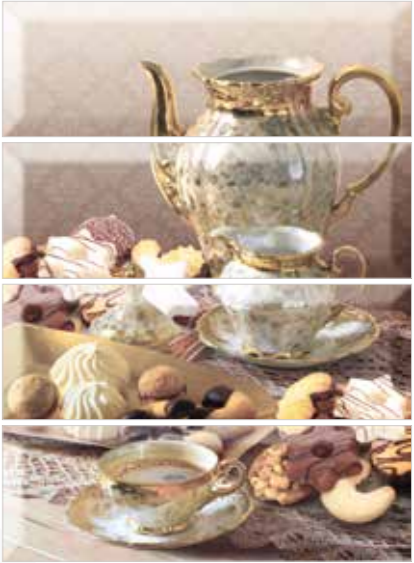
DEC.DULCINEA PLACER (SET 4 PCS) 40X30 MPP290