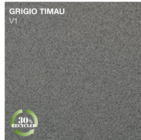
GRIGIO TIMAU V1