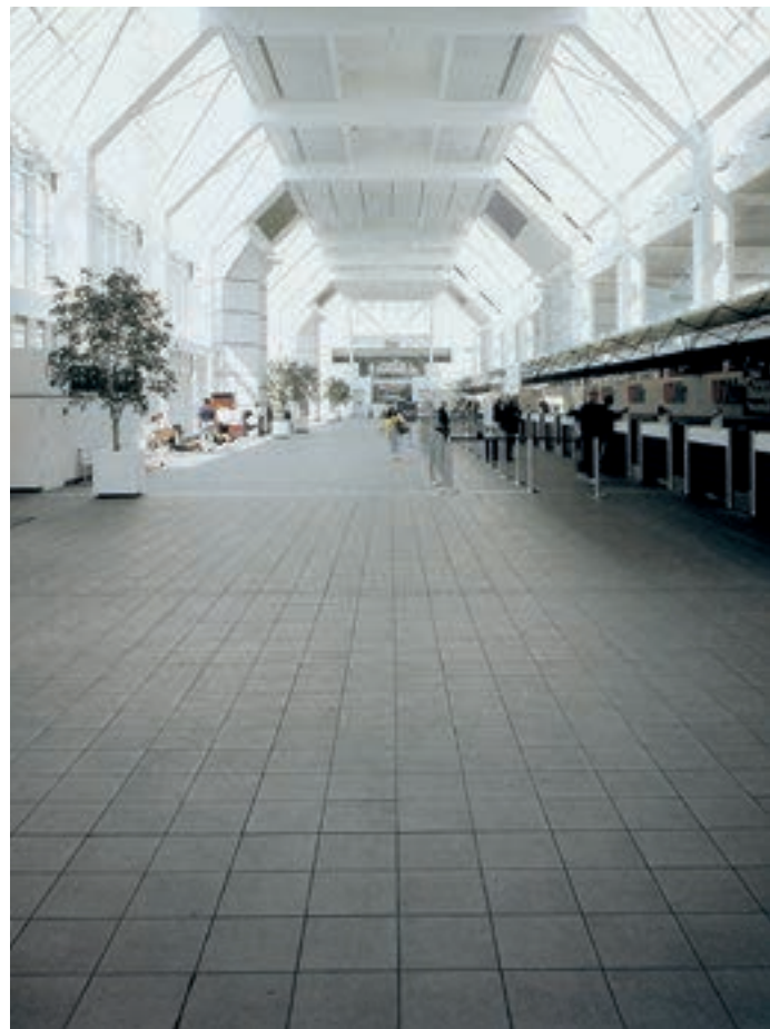
Floor: Grigio Timau

Надежность и универсальность. Коллекция Granigliati, созданная для торговых площадей и больших архитектурных пространств, всегда была коньком в ассортименте Caesar.