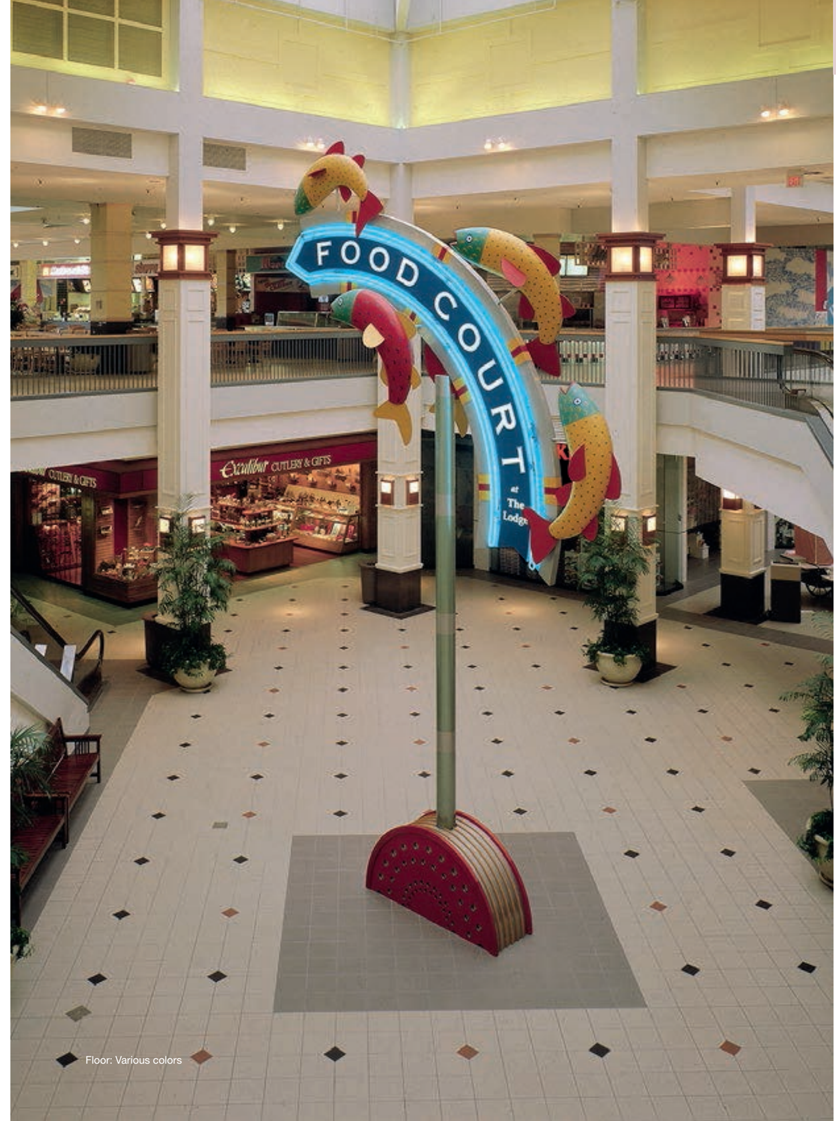
Floor: Various colors