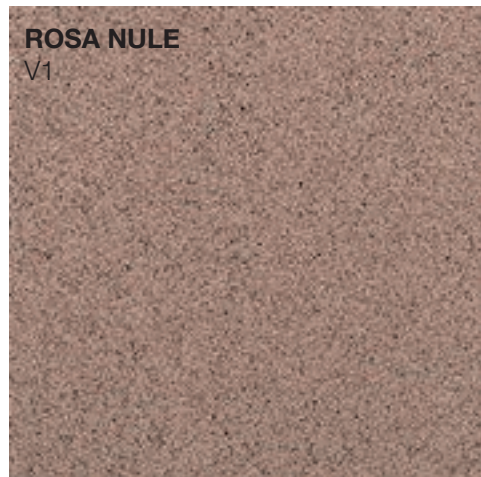
ROSA NULE V1