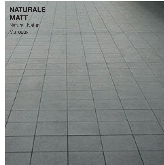
NATURALE MATT Naturel, Natur Матовая

Disponibile nella finitura Naturale che si sviluppa su un'ampia gamma colore. Granigliati è una collezione senza tempo e altamente funzionale per rispondere ad ogni esigenza progettuale.